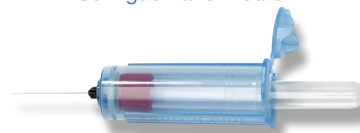
Porte-tubes de recueil de sang VanishPoint®