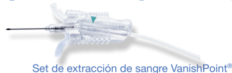
Set de extracción de sangre VanishPoint®