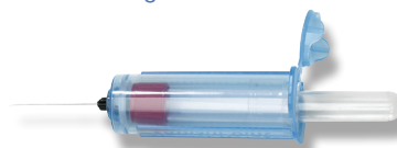
Porta-tubo para muestras sanguíneas VanishPoint®