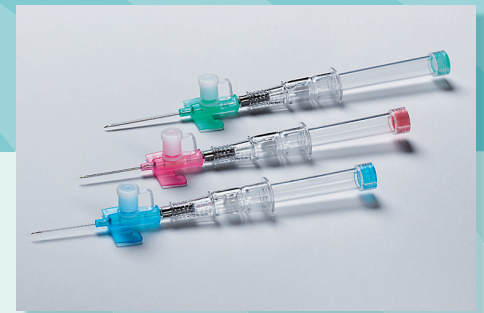
VanishPoint® IV-Katheter mit Port sind in mehreren Längen und Durchmessern erhältlich

Ein Injektions-Port mit Verschluss ermöglicht die sichere und einfache Injektion der Medikation