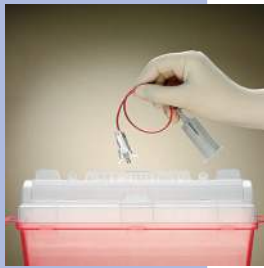
Porta-tubo não incluso

Elimine a conjunto de coleta de sangue VanishPoint® num recipiente apropriado para instrumentos pontiagudos.