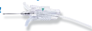
Kit de prélèvement sanguin VanishPoint®