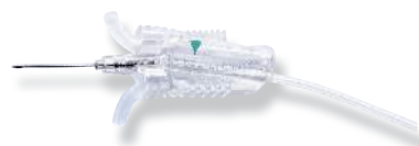
Conjunto de coleta de sangue VanishPoint®