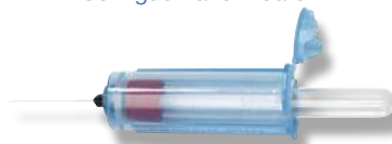
Porte-tubes de recueil de sang VanishPoint®