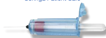
Porta-tubos de Recolha de Sangue VanishPoint®